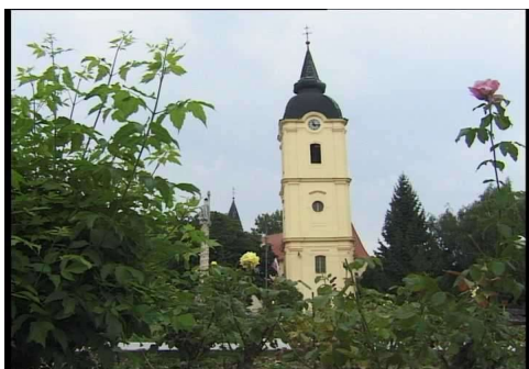
Kostol sv. Martina – Šikmá veža – zvonica

Kultúrnymi pamiatkami nehnuteľného charakteru, ktoré sú zapísané v súpise kultúrnych pamiatok Slovenskej republiky sú: