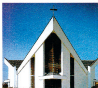
25. výročie posvätenia Kostola Svätého Gorazda vo Vrbovom Močenok 9. 11. 2022