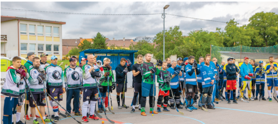
Turnaj bol zrealizovaný s podporou mesta Vrbové.