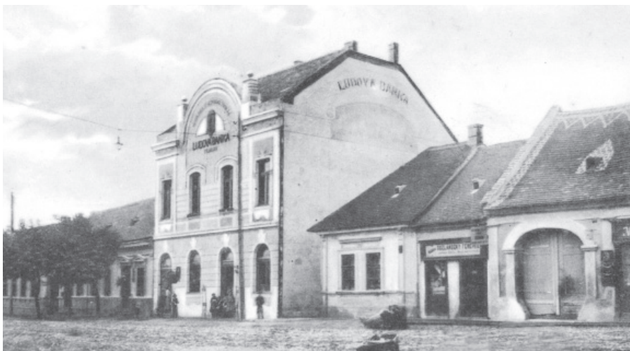
Budova bývalej Ludovej banky, na ktorej je osadená pamätná tabuľa pripomínajúca markovičovské voľby.