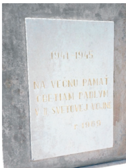
Detail obnoveného pamätníka.