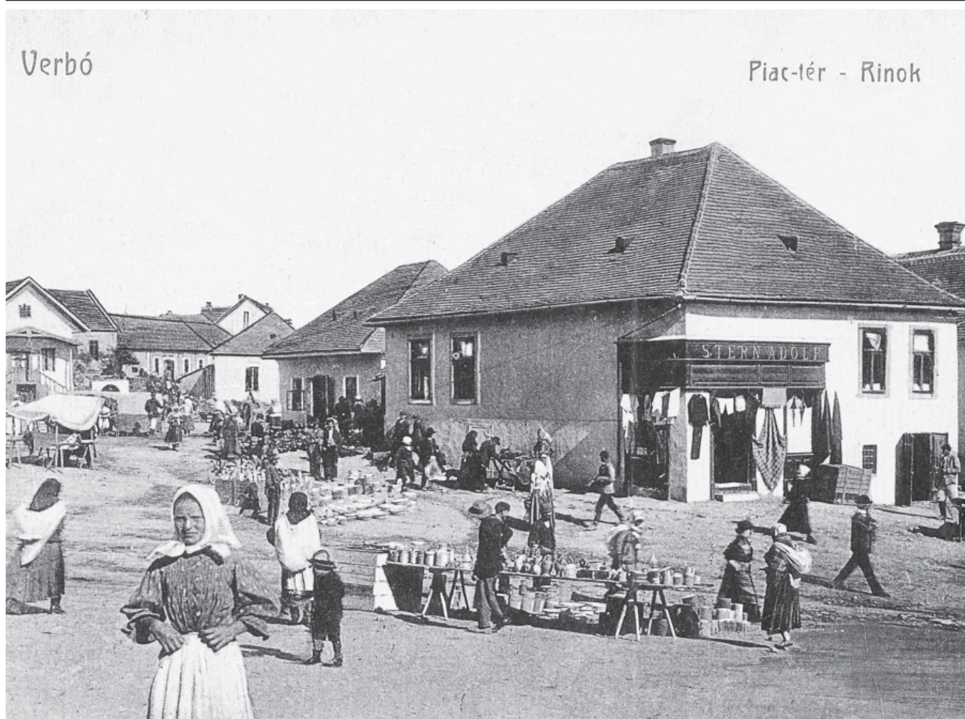
Vrbovský rínok, dnes Námestie slobody, na začiatku 20. storočia.