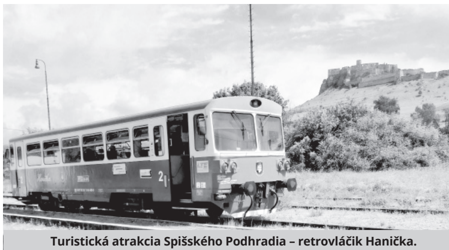
Turistická atrakcia Spišského Podhradia – retrovláčik Hanička.