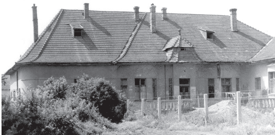
Kúria v Beckovskej Vieske. V roku 2006 ju pre zlý stav museli zbúrať..