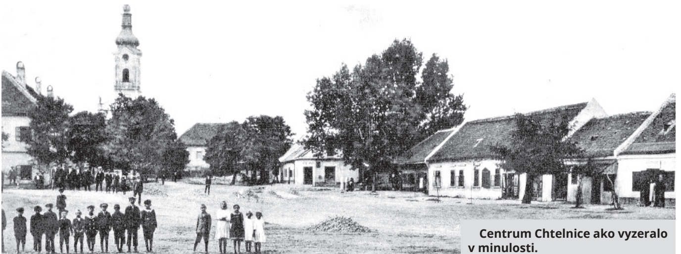
Centrum Chtelnice ako vyzeralo v minulosti.

Chtelnica : Obecný úrad, 1998, s. 162 – 171.