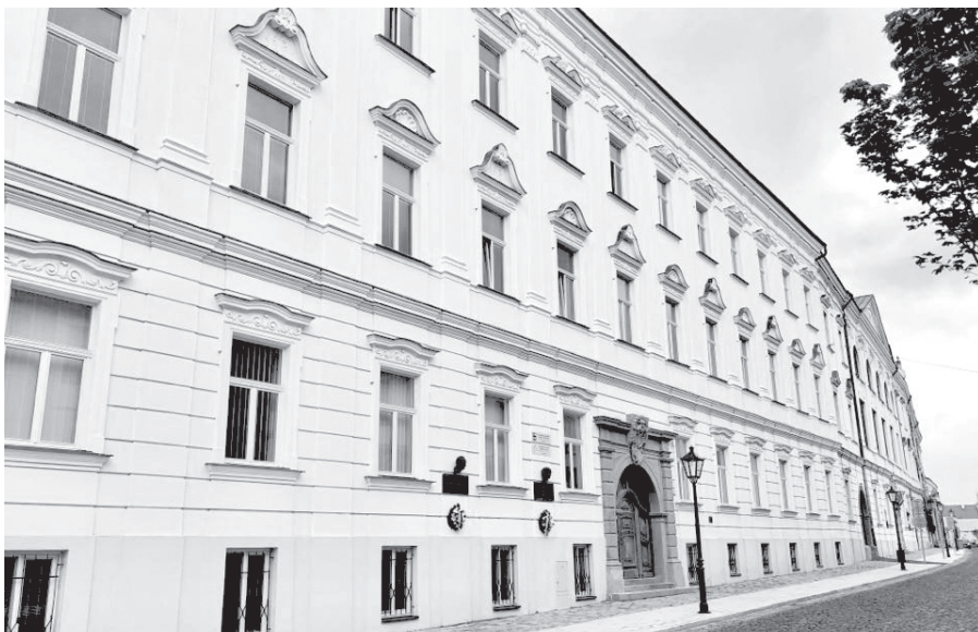
Škola pomenovaná podľa nášho rodáka - Arcibiskupské gymnázium Pavla Jantauscha v Trnave