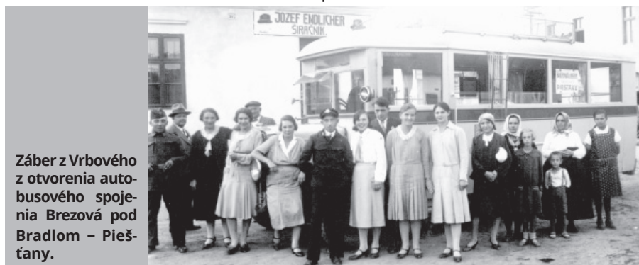
Záber z Vrbového z otvorenia autobusového spojenia Brezová pod Bradlom – Piešťany.

odjazd z Piešťan, okresný súd, o 8.30, 10.20, 12.05, 15.07, 17.00 a 19.25 hod. Odjazd z Vrbového, námestie, o 6.16, 7.41, 9.15, 11.15, 13.01, 15.55 a 18.40 hod. Odjazd z Piešťan, železničná stanica, o 5.53 hod. Doba jazdy bola 35 minút.