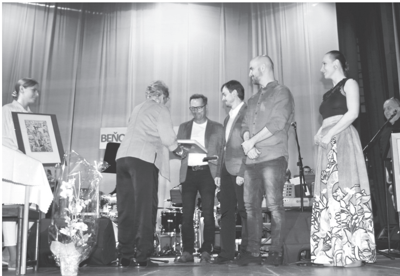
Ocenení si preberajú Cenu mesta Vrbové.