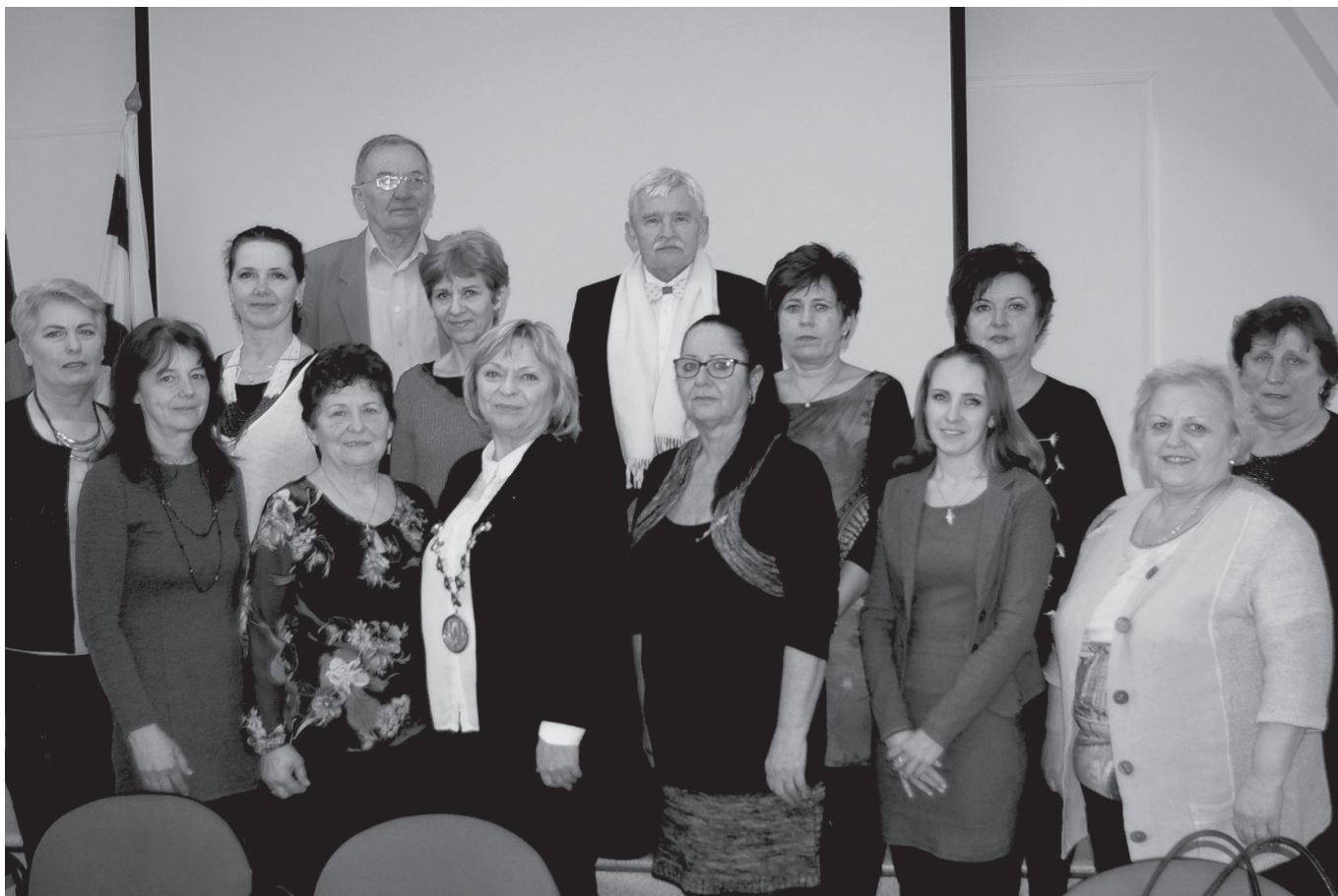
Ocenení učitelia vrbovských škôl si prevzali ocenenie z rúk primátorky mesta.