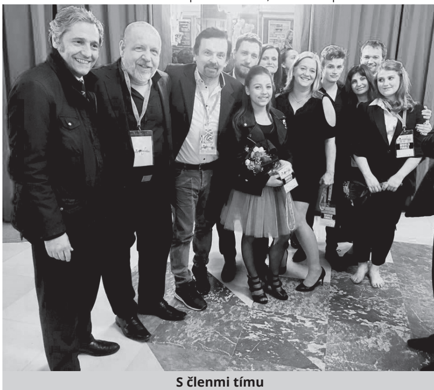
S členmi tímu