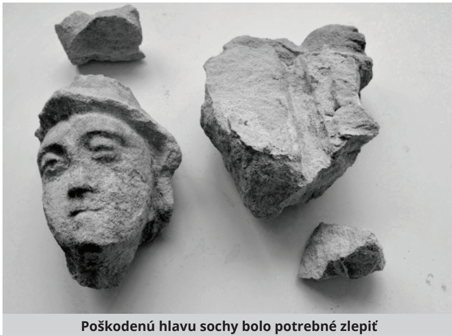
Poškodenú hlavu sochy bolo potrebné zlepiť