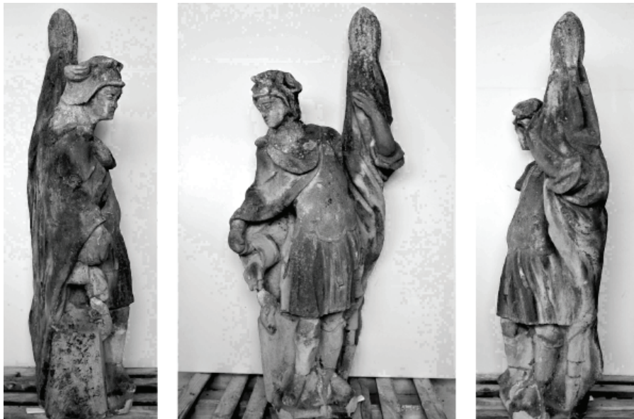
Stav pred rekonštrukciou

dobrovoľný hasičský zbor, ktorého členovia zasahujú pri požiaroch, havarijných udalostiach rôzneho druhu a ochrane zdravia a majetku nás všetkých, ako podakovanie za ich činnosť vedenie mesta Vrbové sa rozhodlo dať