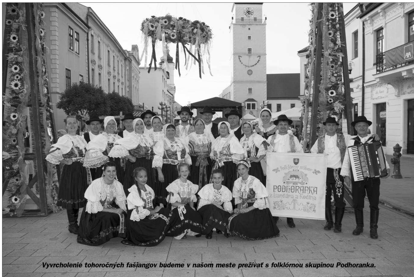
Vyvrcholenie tohoročných fašiangov budeme v našom meste prežívať s folklórnou skupinou Podhoranka.