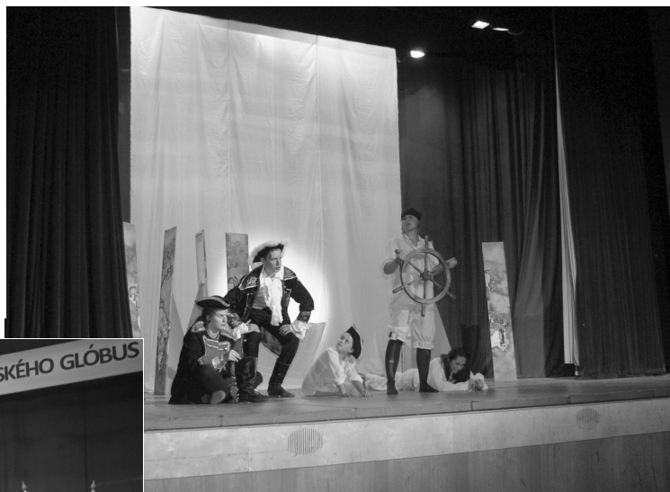
Z divadelného predstavenia Móric Beňovský - kráľ kráľov , ktoré predviedli ilavskí ochotníci